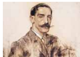
Joaquim Malats (1872-1912)