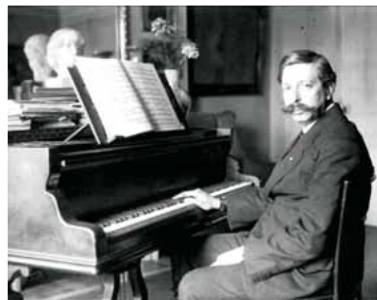
Granados i el seu inseparable piano Pleyel el 1914.