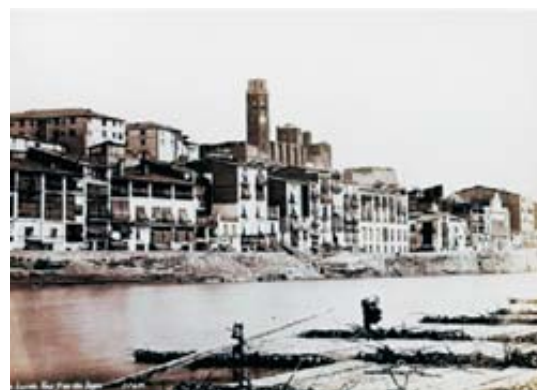
Barcasses per travessar el Segre al seu pas per Lleida

Lleida , a cavall entre els segles XIX i XX era una petita capital de província que, a poc a poc anava entrant en la modernitat gràcies a l'impuls de la Renaixença i de l'incipient Modernisme. Sabem que hi havia una vida musical força activa: Orfeó Lleydatà (1861), primeres bandes i orquestres, societats tipus Cors Clavé, associacions musicals i la creació de l'Escola Municipal de Música el 1915 (bressol de l'actual Conservatori).