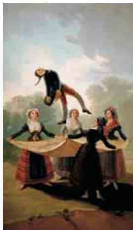
"El pelele": pintura i música.