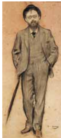
Isaac Albéniz (1860-1909)