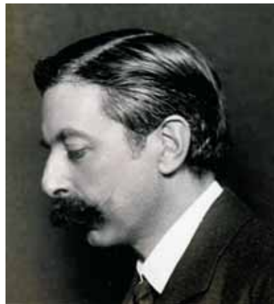
1916, New York: una de les darreres fotografies del mestre...

La creació de la seva pròpia acadèmia de piano i l'elaboració contínua d'obres i escrits didàctics confirmen una gran vocació per a l'ensenyament. També cal remarcar que Granados era un home d'una gran cultura i que anava més enllà d'ensenyar només la tècnica de l'instrument, ja que sempre va procurar transmetre als seus i les seves deixebles l'interès per l'art i la poesia.