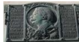
Casa nadiua d'Enric Granados al núm. 1 del carrer Marquès de Tallada. Placa commemorativa.