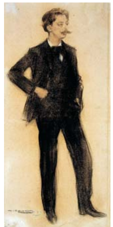
Granados per Ramon Casas (1866-1932), pintor modernista autor d'un seguit de cèlebres retrats al carbó de personalitats diverses del moment.

Entre 1905 i 1908, es construirà el Palau de la Música Catalana on Granados estrenarà moltes composicions i hi actuarà tot sovint. Cal destacar també el moviment wagnerià, la tradició dels cors Clavé, la riquesa del folklore popular i les nombroses publicacions i editorials musicals d'aquella època.