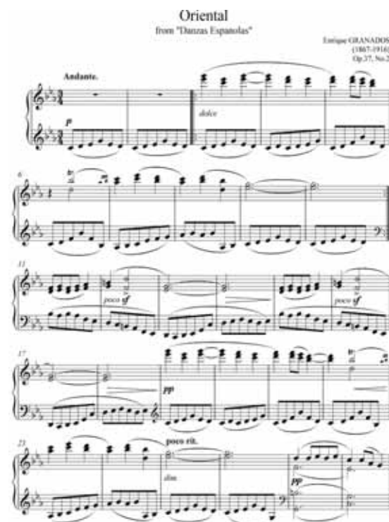
Inici de la Dansa núm. 2 "Oriental".