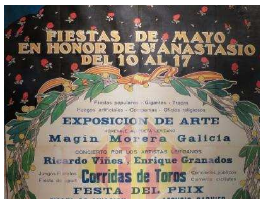
Cartell de la Festa Major de 1912 on s'anuncia el concert de Viñes i Granados... que finalment no va poder ser