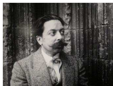
Granados a la Seu Vella el 1911