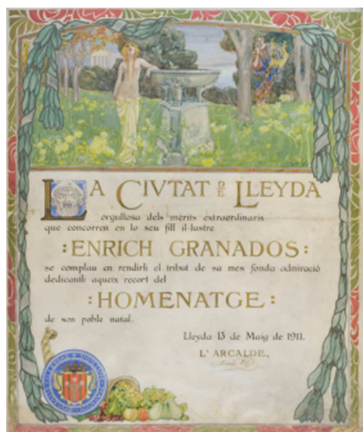
Diploma de la ciutat de Lleida a Enric Granados, obra de Baldomer Gili i Roig el 1911.